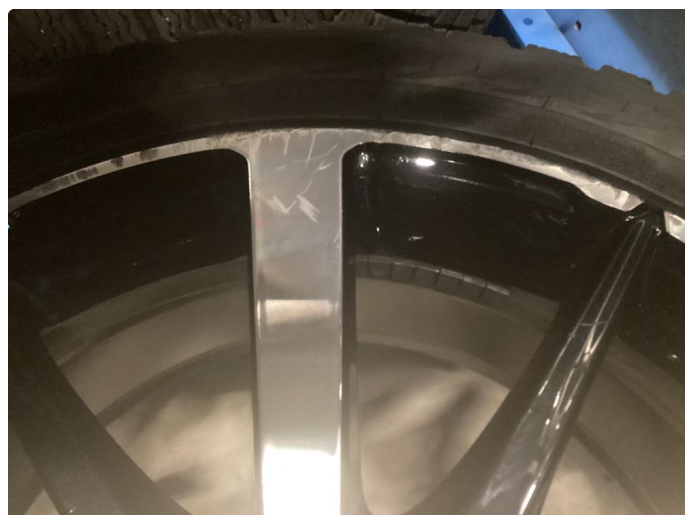
1.3 Skade på felg