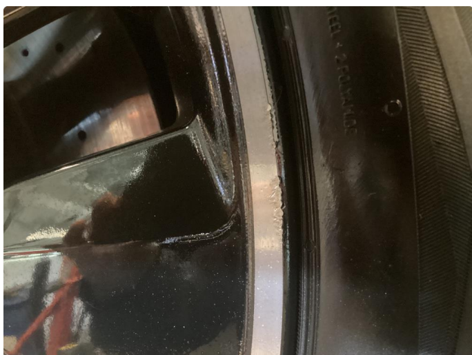
1.2 Skade på felg