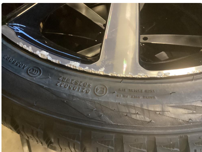
1.3 Skade på felg