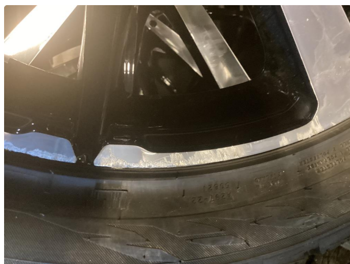
1.3 Skade på felg