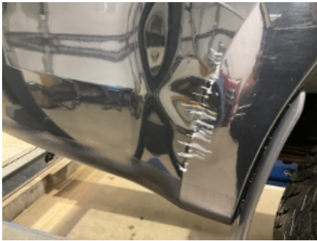
1. Lakk / karosseri utvendig