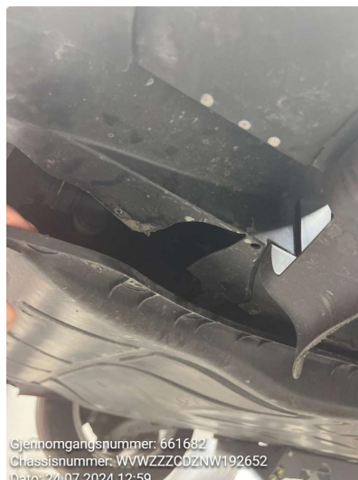
1.2 Beskyttelsesplate skadet/mangler