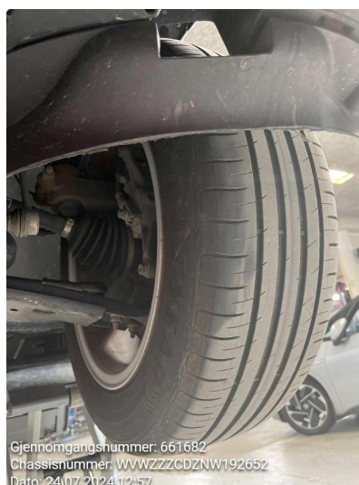
1.4 Skjev slitasje på sommerdekk