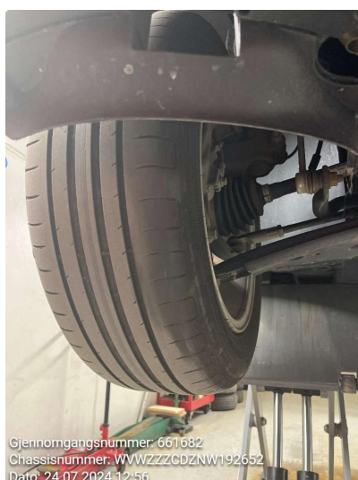
1.4 Skjev slitasje på sommerdekk