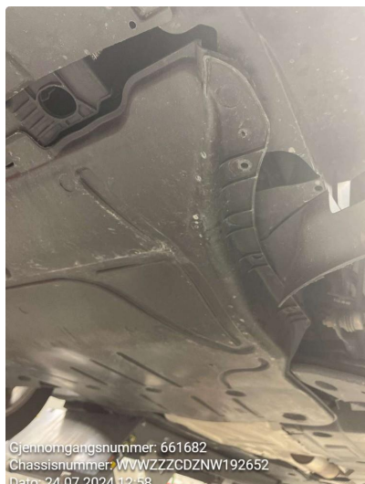
1.1 Beskyttelsesplate skadet/mangler