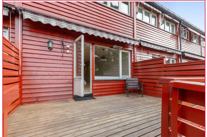
Boligen har stor terrasse med god plass til utemøbler.