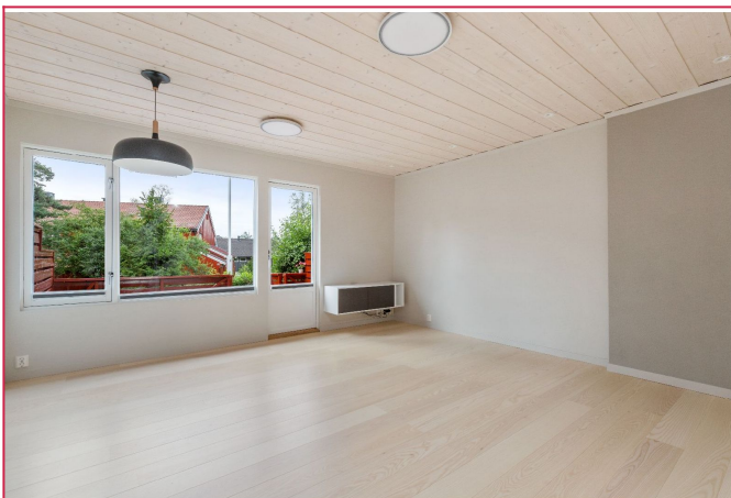
Stue med utgang til terrasse og hage.