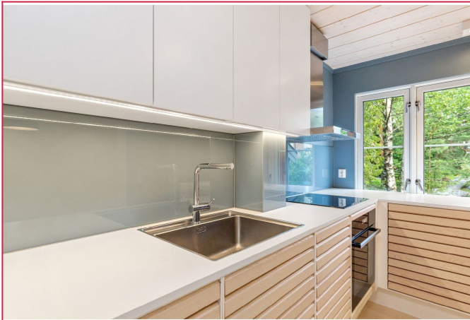
Kjøkken med alle hvitevarer inkludert.