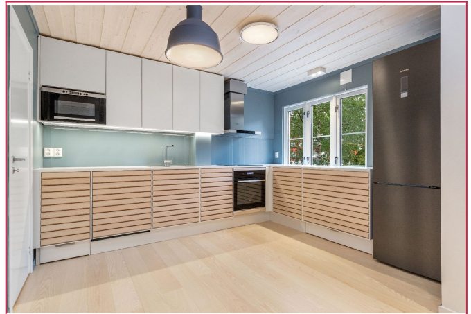
Designkjøkken fra Svane.