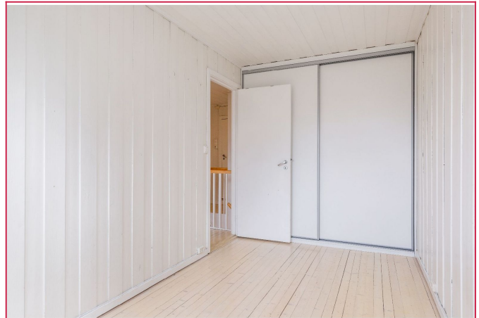
Soverom med skyvedørsgarderobe.