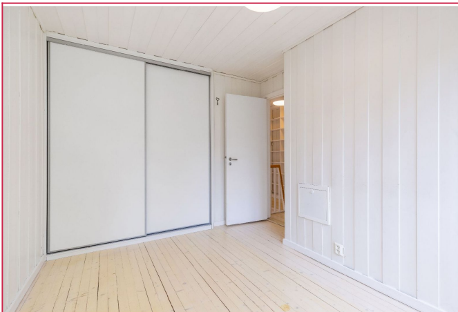
Soverom med skyvedørsgarderobe.