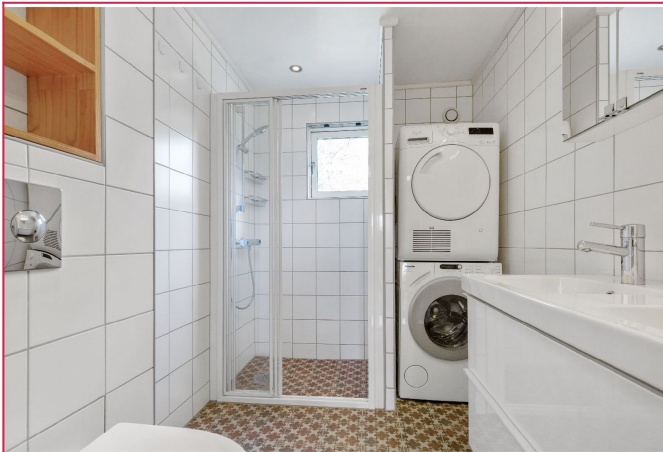
Lekker baderom med vaskemaskin og tørketrommel.