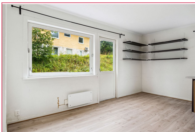
Stue, med god plass til sofakrok og spise plass