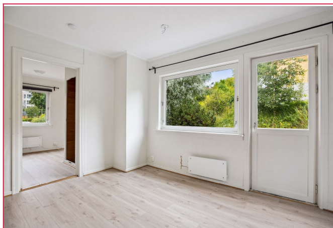
Stue med dør direkte til uteplass.