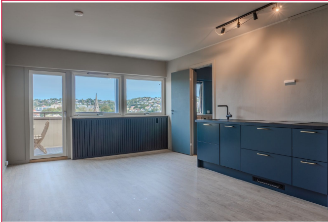
Kjøkkenet er moderne og funksjonelt, med godt med skapplass og arbeidsflate.