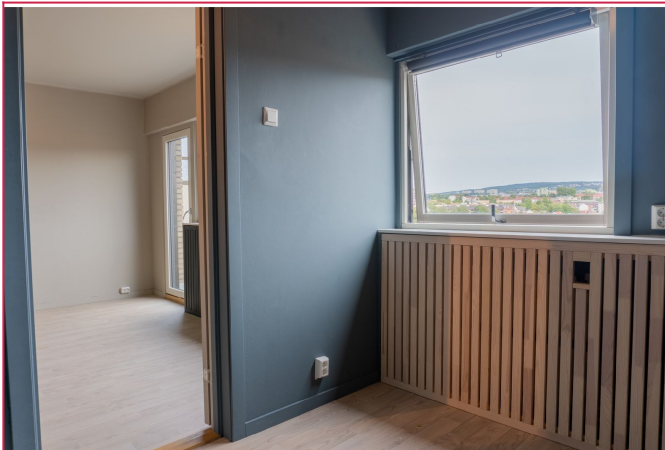
Soverommet er det plass til dobbeltseng og har flott utsikt.