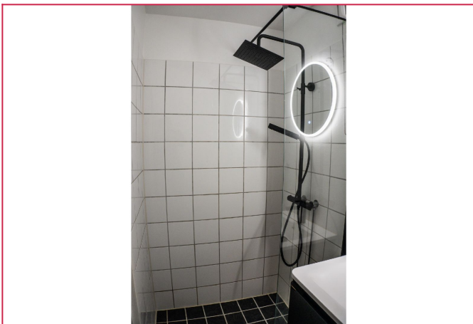
Badet er stilrent og praktisk.