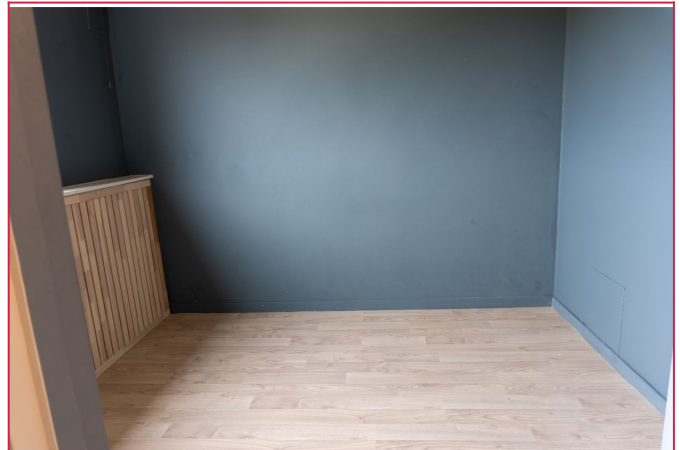
Oppvarming, varmtvann og internett er inkludert i leien, og bygningen har heis for enkel adkomst.