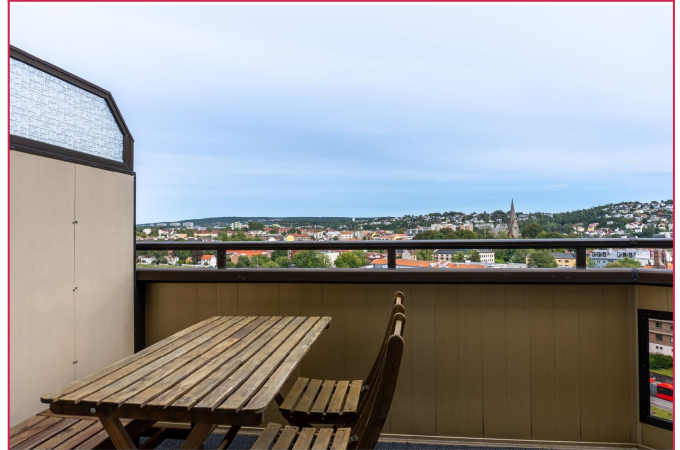
Nyt panoramautsikt fra denne toppleiligheten i 12. etasje.