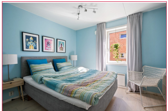
Soverom- alle møblene medfølger.