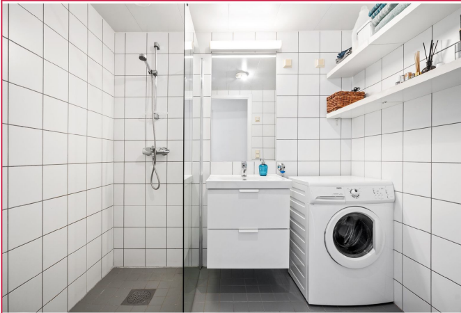
Flislagt bad med varmekabler.