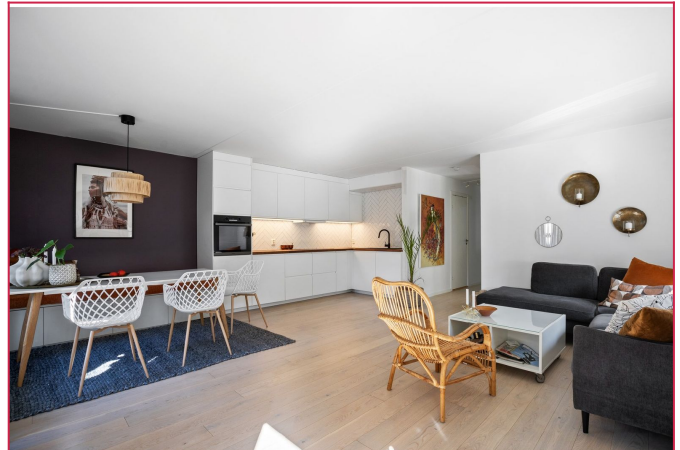
Kjøkken med hvitevarer og kjøkkenutstyr inkl.