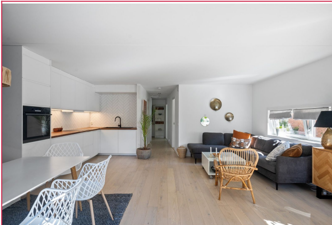
Åpen stue og kjøkkenløsning med tilhørende møblement.