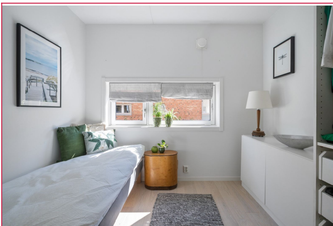
Soverom-alle møblene medfølger.