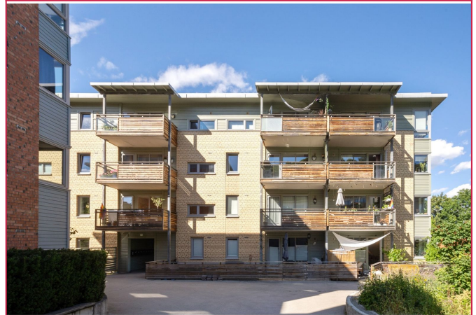
Kabel TV, internett og varmtvann er inkl.