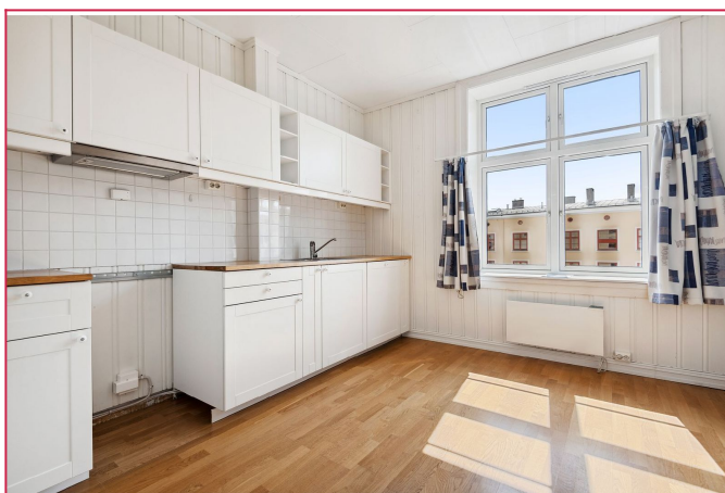
Plass til spisebord på kjøkken.