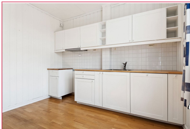
Kjøkkeninnredning av nyere dato.