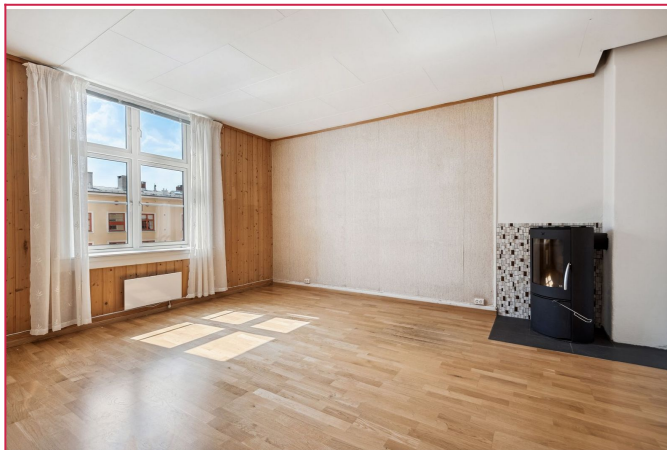
Peis i stue.