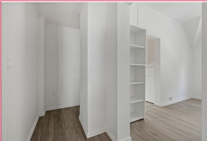
Gang - bad inn til venstre, og stue til høyre.