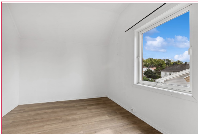
Det største soverommet