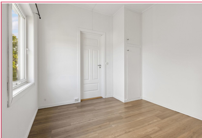
Det største rommet