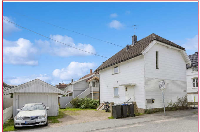
Leiligheten ligger i 2.etg.