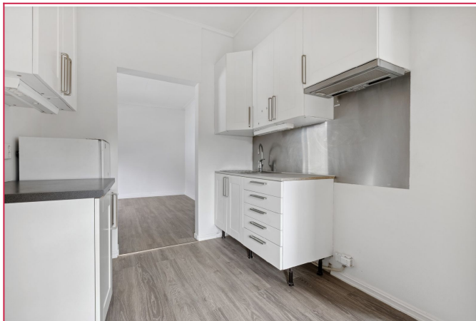
Komfyr vil settes inn