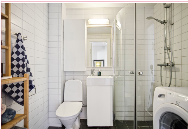
Flislagt bad med varmekabler i gulv. Bra med oppbevaring. Opplegg for vaskemaskin.