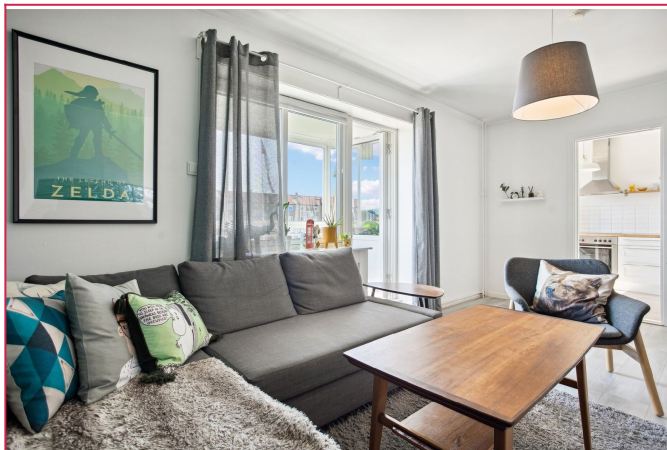
Leiligheten leies ut delvis møblert, og det er varmtvann, fyring, tv- og nettpakke inkl.