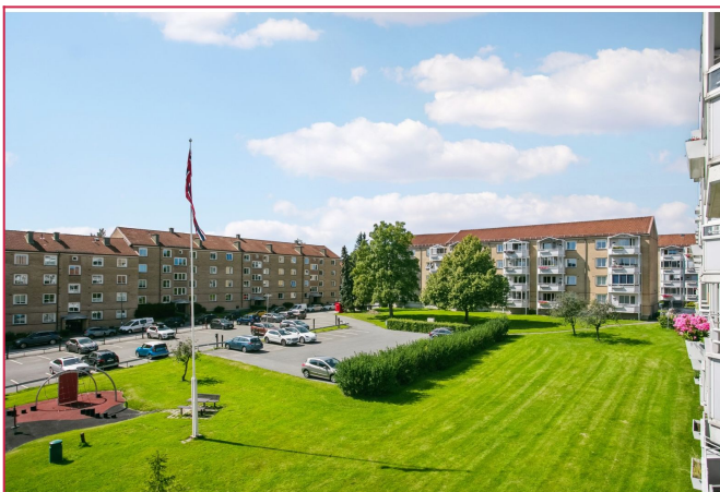
Boligen ligger i et populært og rolig område på Kalbakken.