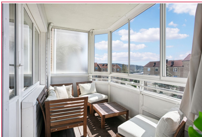
Romslig og lys innglasset balkong med utemøbler.