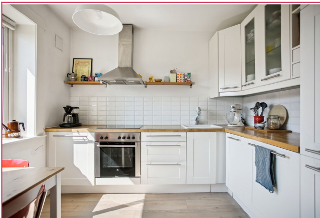
Stilig kjøkken med alle hvitevarer integrert. Bra meg benke- og skaplass.