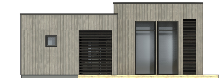
FASADE 4 1 : 100