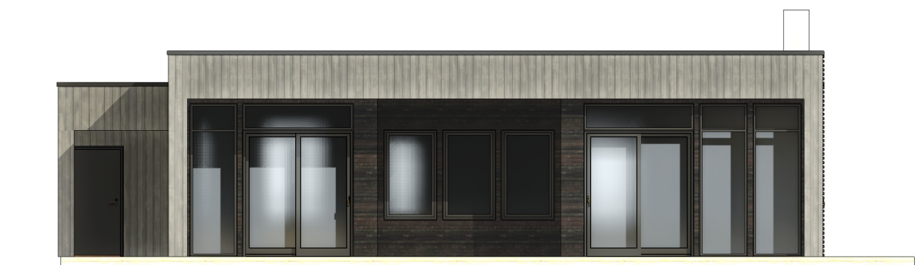
FASADE 1 1 : 100