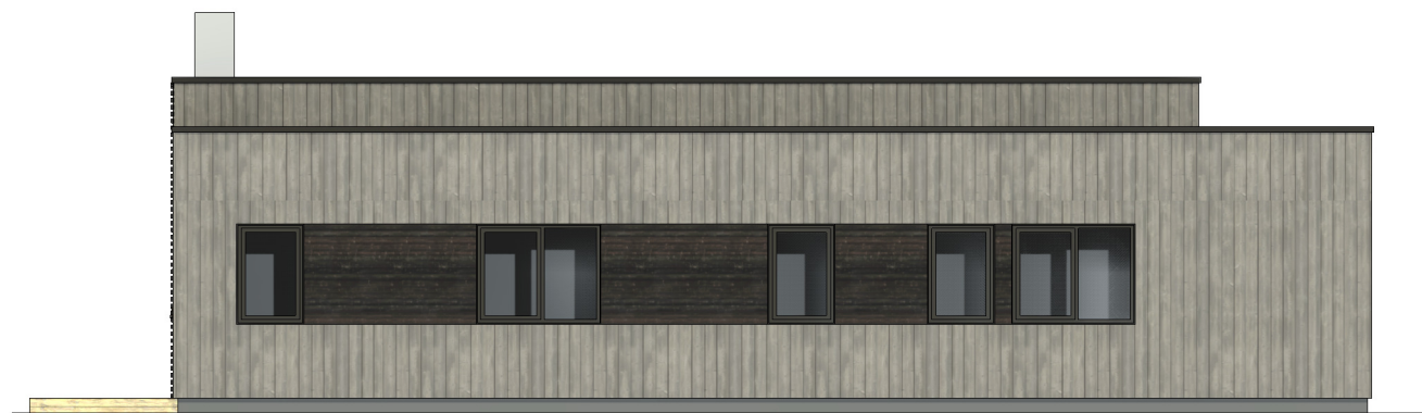
FASADE 3 1 : 100