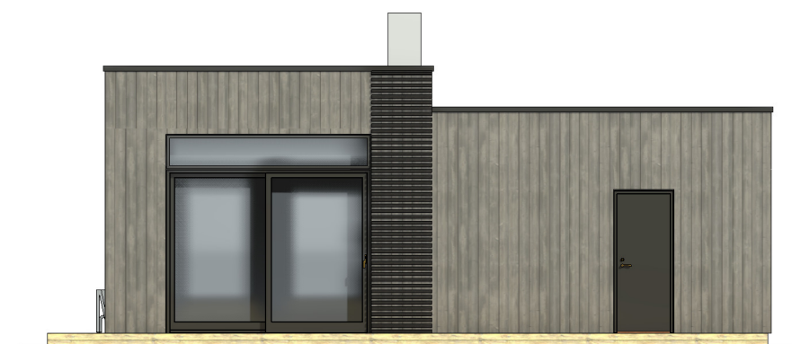
FASADE 2 1 : 100