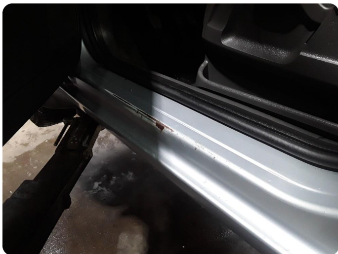
2.9 Slitt innsteg -ink rust venstre foran