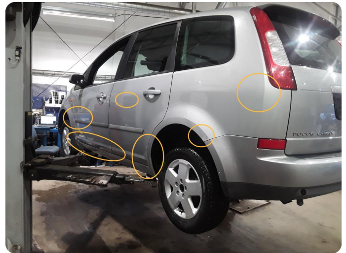
2.1 Generelt mye riper og småbulker -inkmnoe rust og ufagmessig utført arbeid