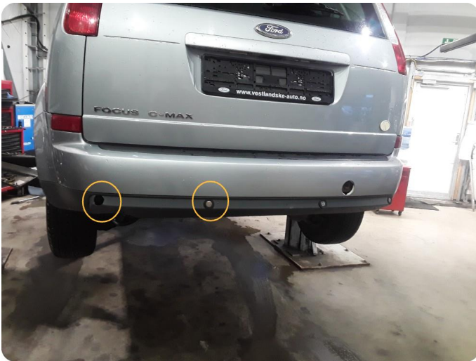
1.1 Funksjonsfeil på avstandsmåler