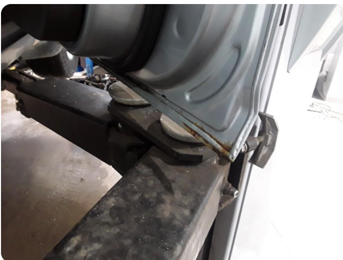
2.4 Rust i fals