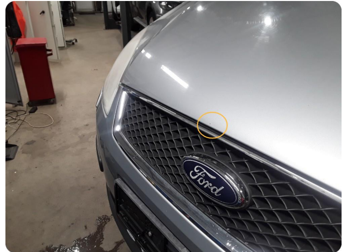
2.3 Noe steinsprut med rust