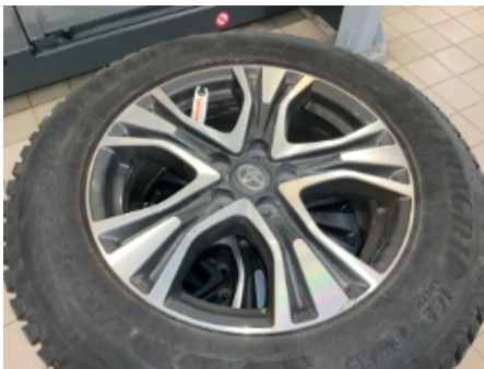
31. Ekstra hjulsett