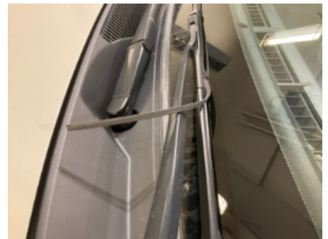
33. Vindusvisker, spyer (foran/bak)