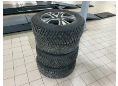
30. Ekstra hjulsett