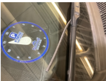
34. Vindusvisker, spyer (foran/bak)