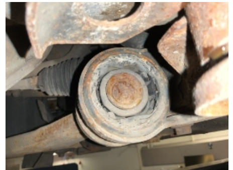
42. Opphengs- / bærearmer foraksel