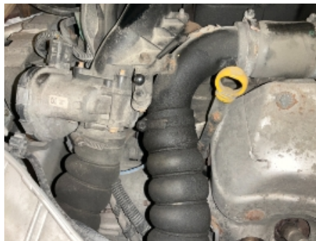
56. Utvendig tilstand motor