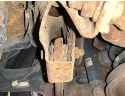
46. Opphengs- / bærearmer bakaksel