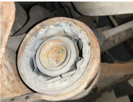
43. Opphengs- / bærearmer foraksel