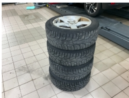
35. Ekstra hjulsett