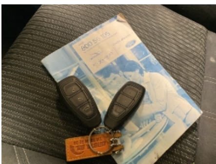
22. Nøkler / Utstyr