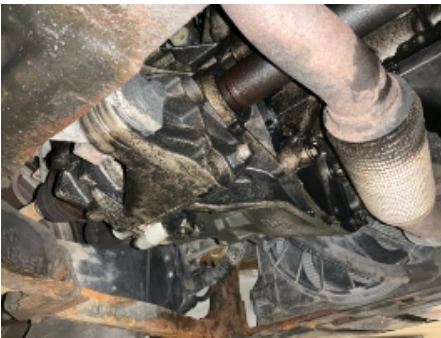
40. Girkasse (manuell)