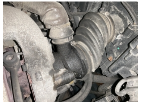
57. Utvendig tilstand motor