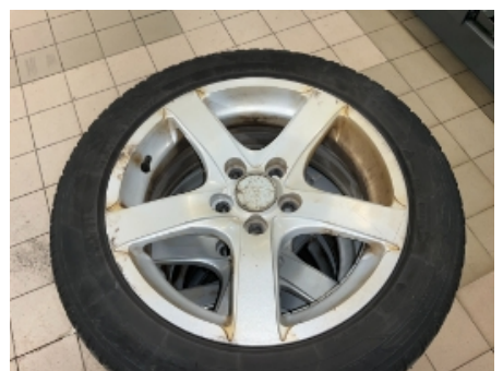
36. Ekstra hjulsett