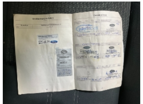
21. Nøkler / Utstyr