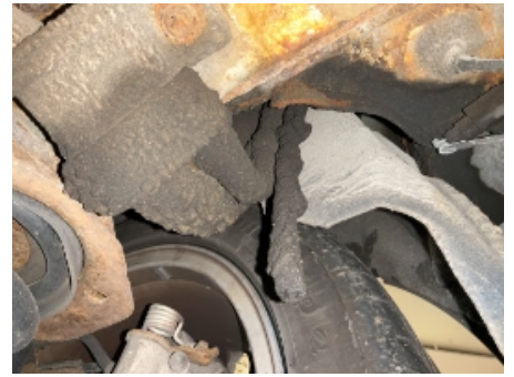
51. Utvendig tilstand motor