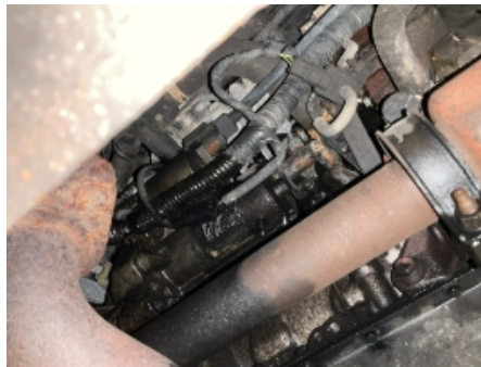
41. Utvendig tilstand motor