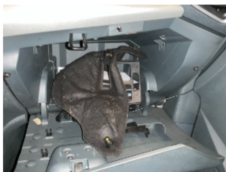
23. Nøkler / Utstyr