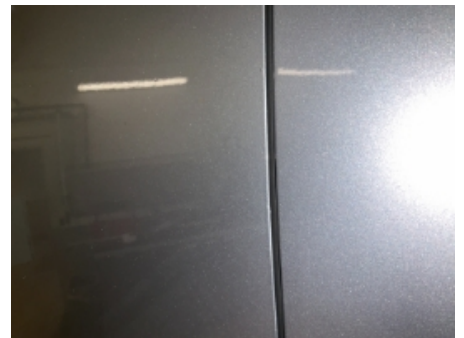
33. Lakk / karosseri utvendig