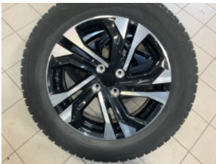
40. Ekstra hjulsett