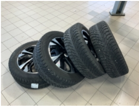
37. Ekstra hjulsett