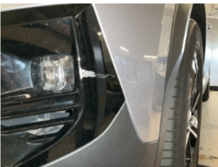
22. Lakk / karosseri utvendig