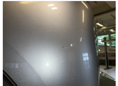
30. Lakk / karosseri utvendig