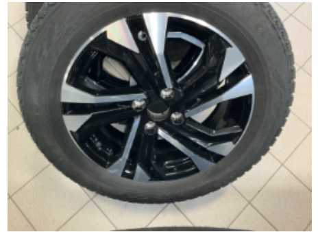
39. Ekstra hjulsett