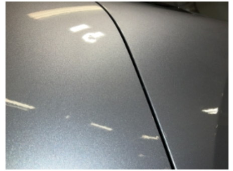
27. Lakk / karosseri utvendig