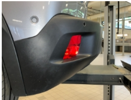
29. Lakk / karosseri utvendig