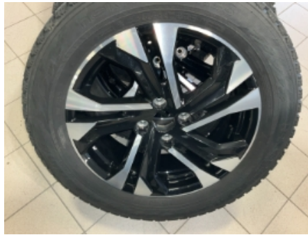
38. Ekstra hjulsett