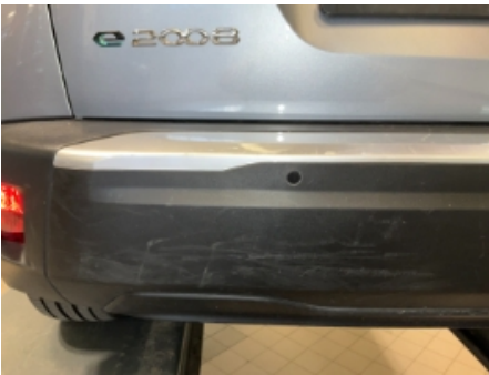
28. Lakk / karosseri utvendig