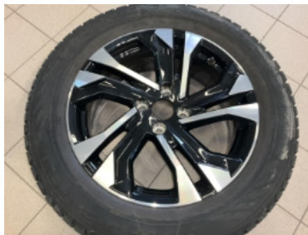
41. Ekstra hjulsett