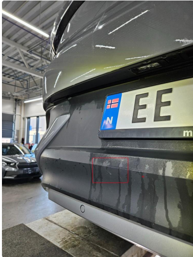
1.3 Små skrubbermerker på ulakkert plast bak