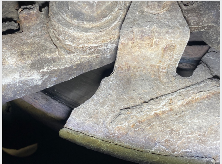
9.7 Skiver foran, stor slitekant