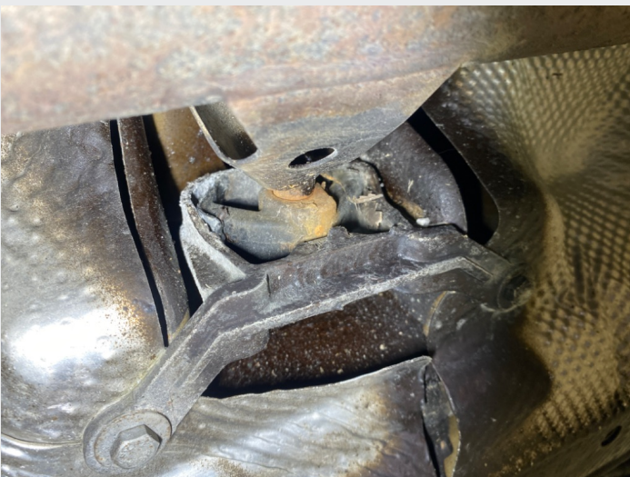
5.6 Feste midt under begynt å løsne