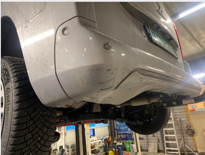
2.8 Bakfanger bulk og skade H side