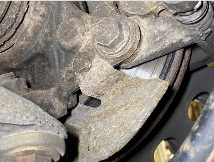
9.7 Skiver foran, stor slitekant