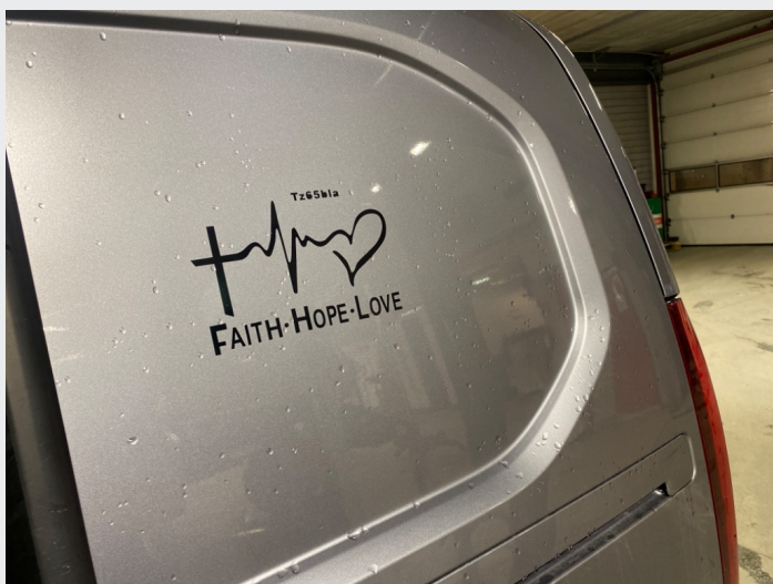
2.7 Reklame på bil venstre bakskjerm