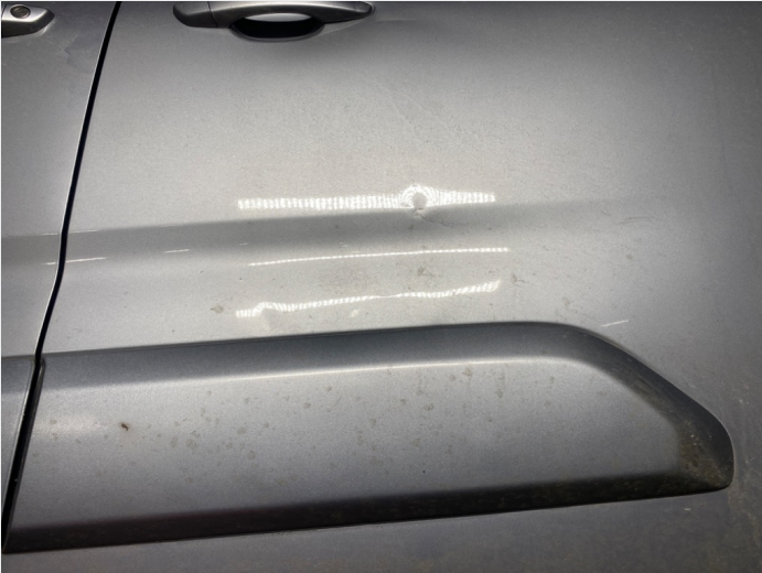
2.5 Mye bulker skyvedør V. S