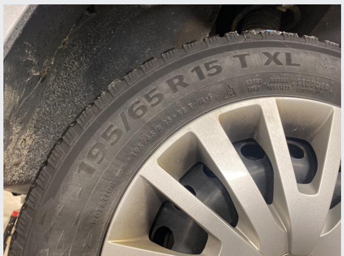
2.17 Mangler mye pigg i dekk