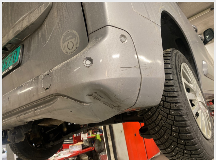
2.8 Bakfanger bulk og skade H side