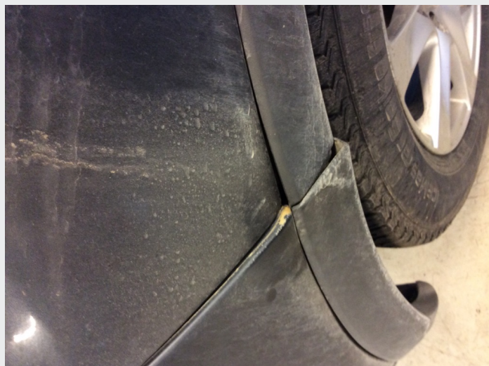
2.8 En del steinsprut f. Løsnet litt h b