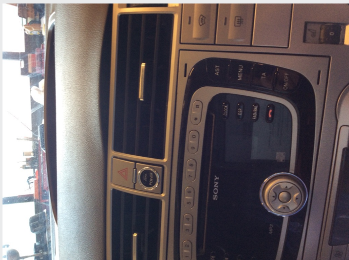
4.1 Polstring løsnet over luftdyse.