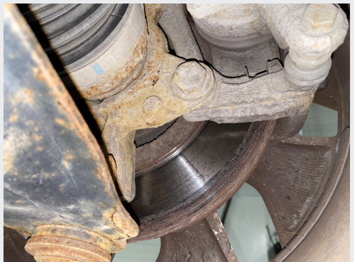
9.7 Utslitte skiver foran