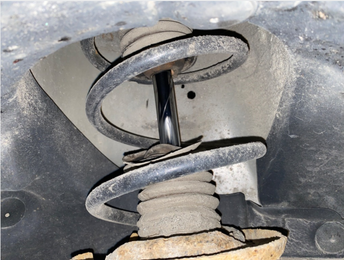
8.6 Revnet mansjetter dempere foran