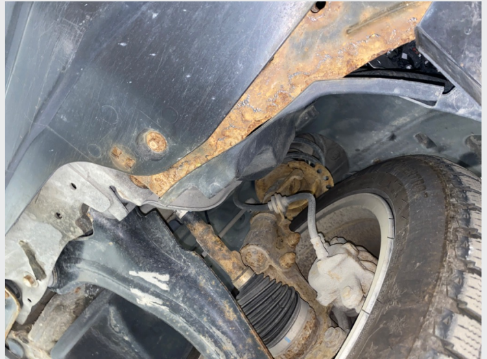
8.5 Rustet forstilling