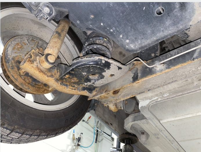
8.5 Rustet bakstilling