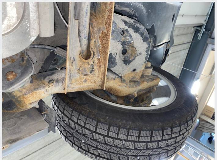
8.5 Rustet bakstilling