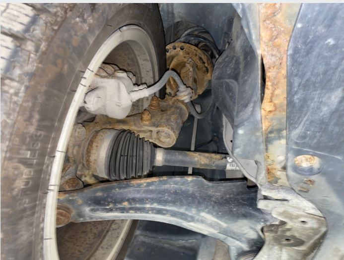
8.5 Rustet forstilling