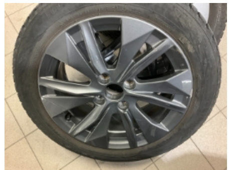
30. Ekstra hjulsett