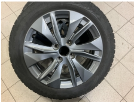
31. Ekstra hjulsett