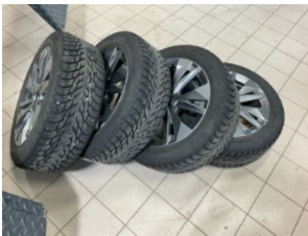
28. Ekstra hjulsett