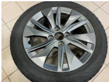
32. Ekstra hjulsett