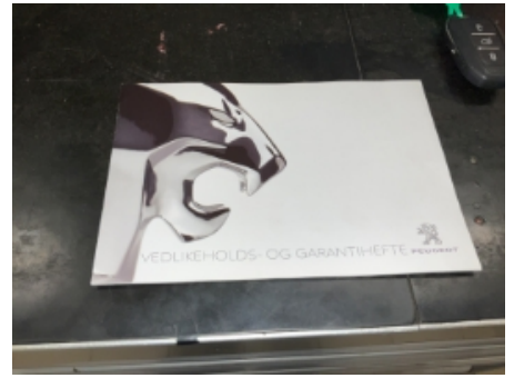
39. Service/ Dokum.