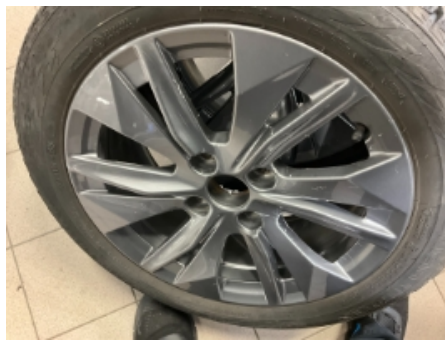
29. Ekstra hjulsett