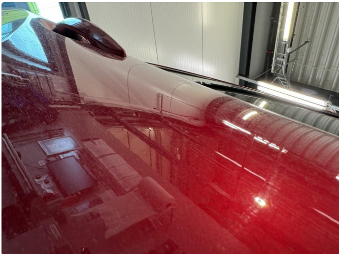
1.2 Liten bulk