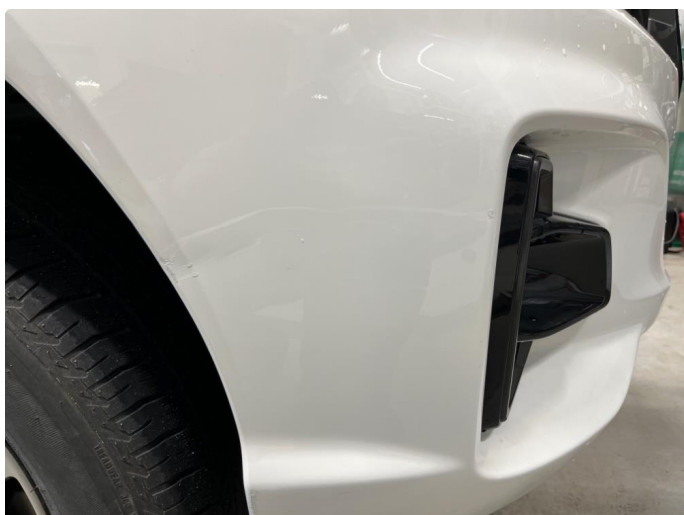
1.2 Ripe som er flekket.