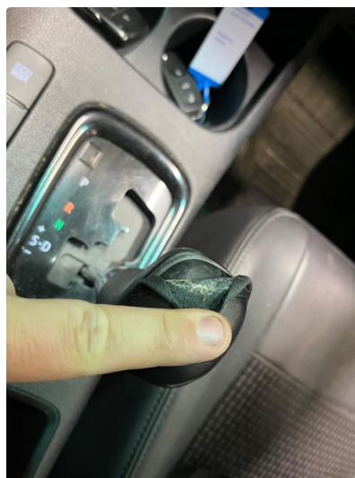
2.1 Girmansjett slitt