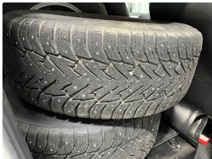
1.1 Godt mønster, slitasje på pigger.