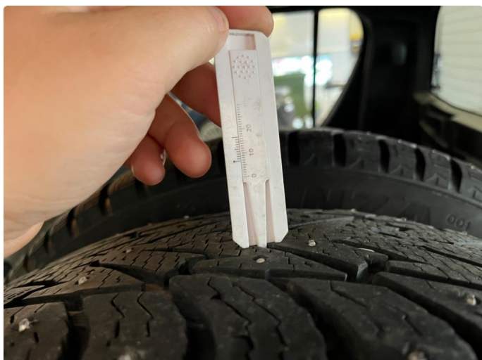
1.1 Godt mønster, slitasje på pigger.