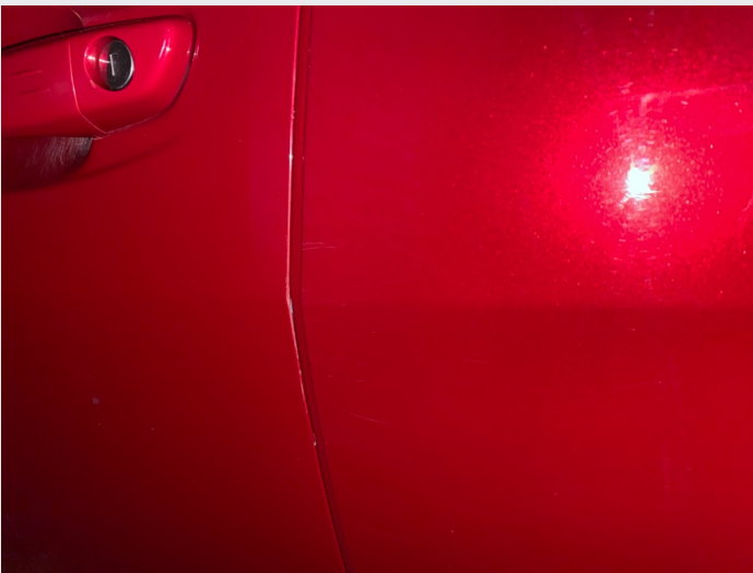
2.5 Førerdør, hakk på kant av dør