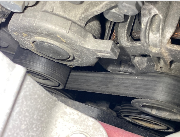
5.11 Ser det er noe slittasje på utside multireim, bør sjekkes om det er TSB