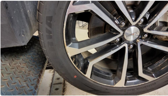
1.1 Skade på felg