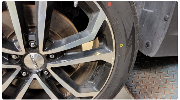
1.1 Skade på felg