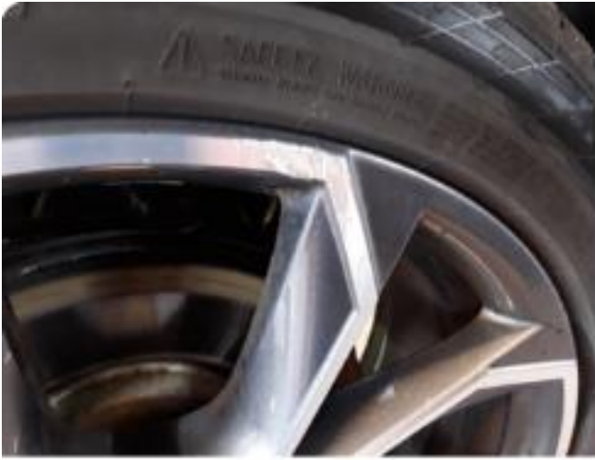
1.2 2 noe kantkjørte sommerfelger.