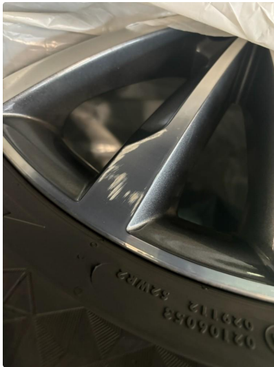
1.3 Noe kantkjørt vinterfelg.