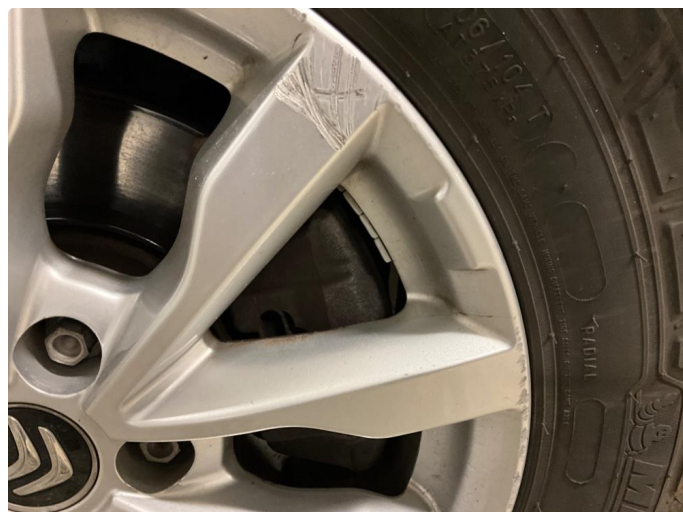
1.1 Kantkjørt felg h. foran (sommer)