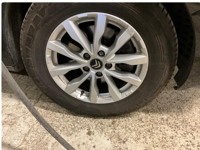
1.1 Kantkjørt felg h. foran (sommer)