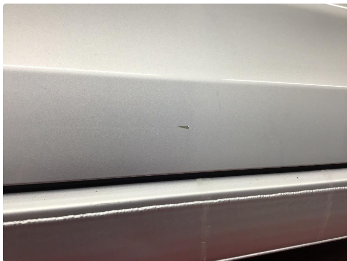
1.6 Ripe ned til grunning