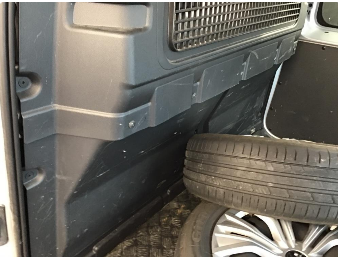
2.2 Deksler skadet/mangler