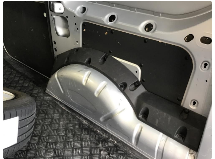
2.2 Deksler skadet/mangler