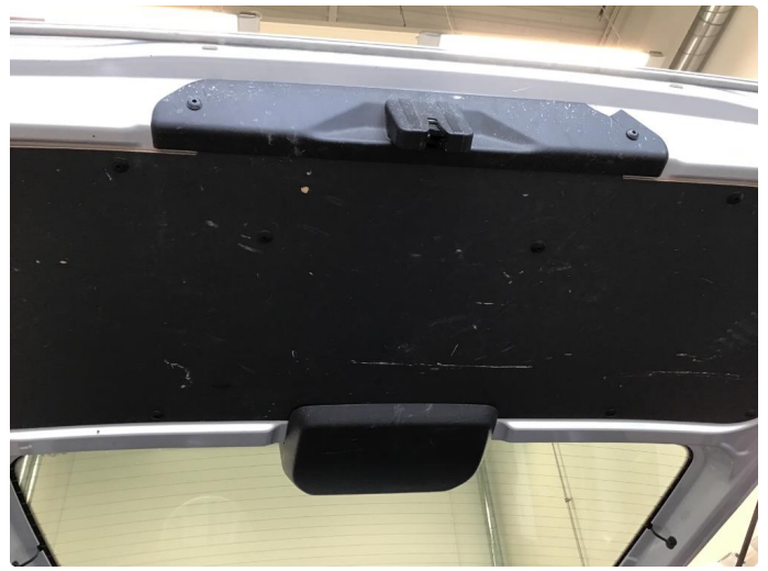
2.2 Deksler skadet/mangler