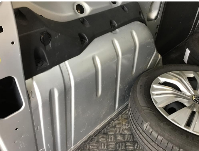
2.2 Deksler skadet/mangler