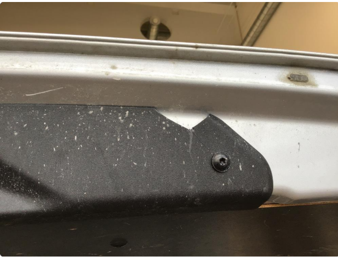
2.2 Deksler skadet/mangler