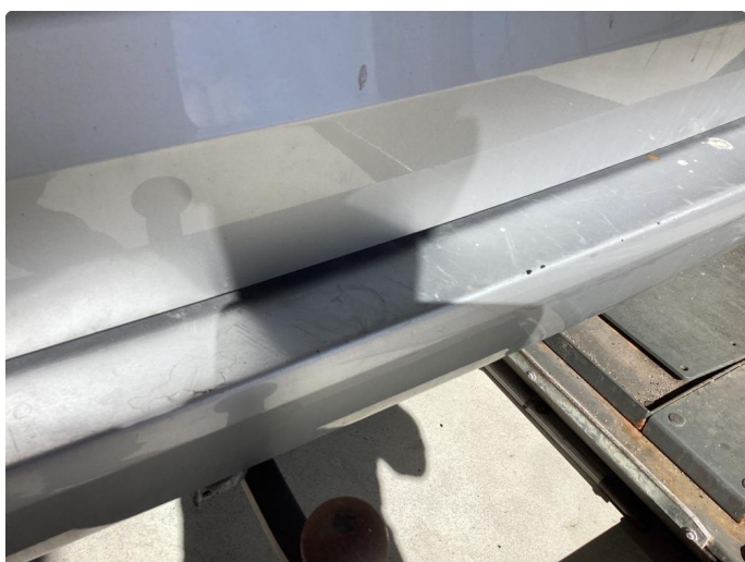
1.5 Plastrep og hellakkering