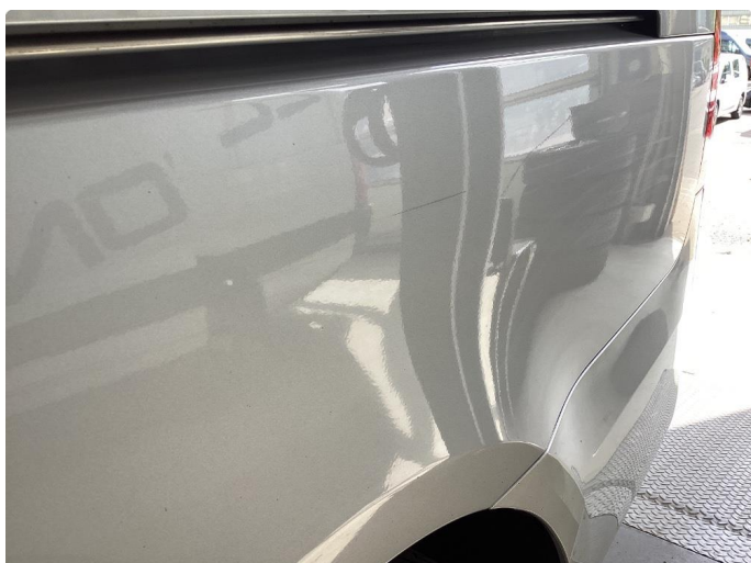
1.4 Ripe(r) ned til grunning