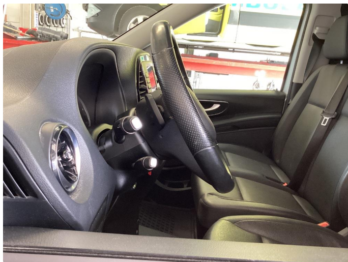
2.1 Øvrige feil