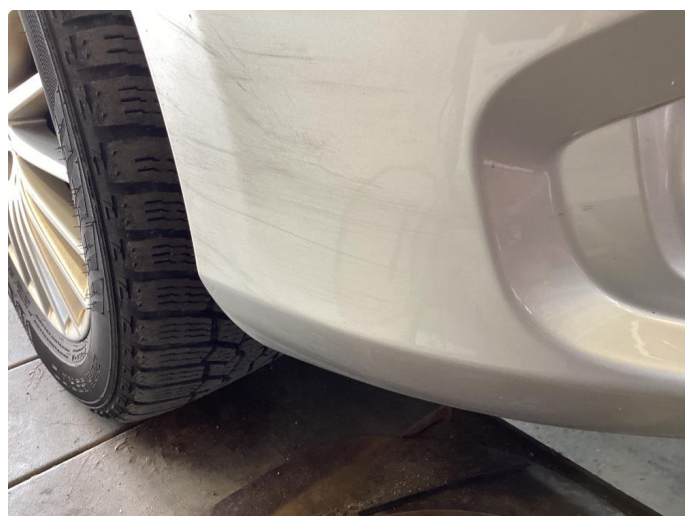
1.6 Ripe(r) ned til grunning