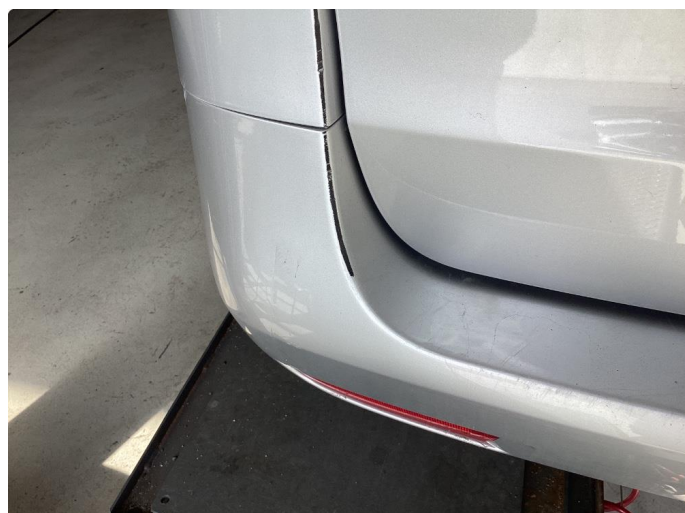
1.5 Plastrep og hellakkering