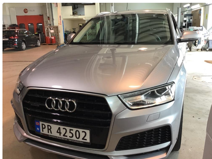
4.1 Øvrig opplysninger