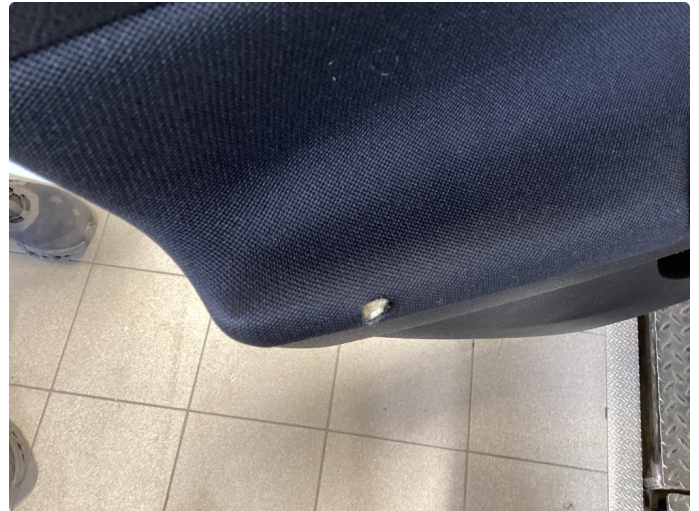
2.1 Bruks merke