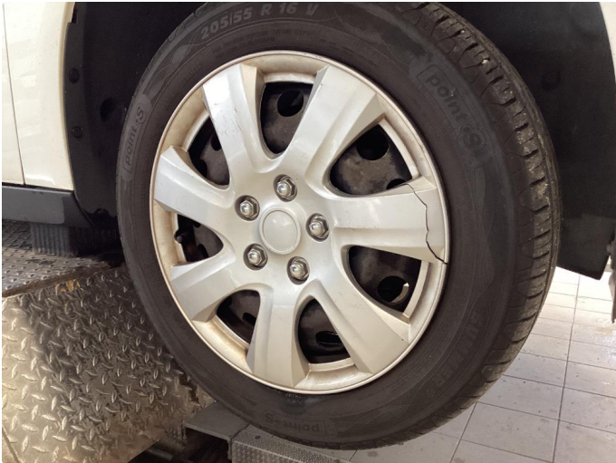
1.1 Hjulksel skadet