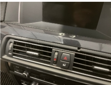
4. Dashbord / midtkonsoll