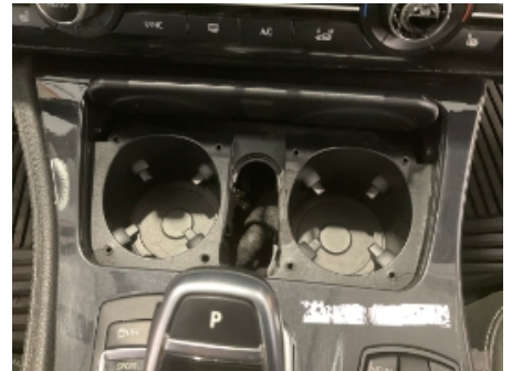
3. Dashbord / midtkonsoll