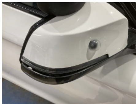
5. Utvendig speil