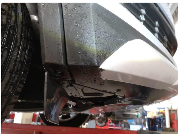
1.4 Skrubbskader underkant