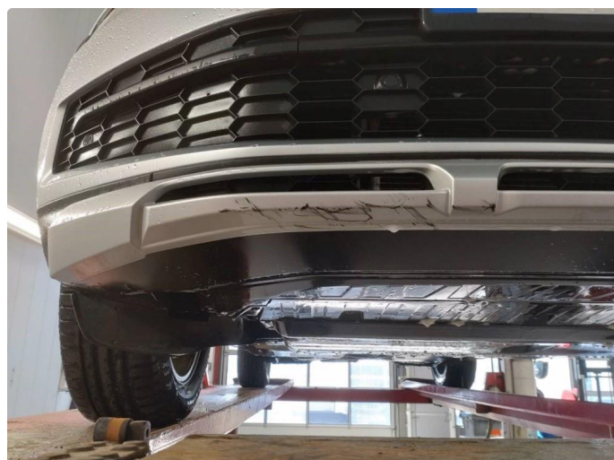
1.4 Skrubbskader underkant