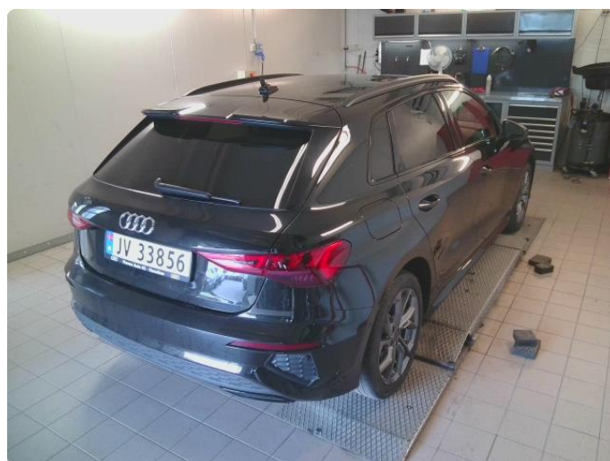
2.1 Ripe høyre bakfanger