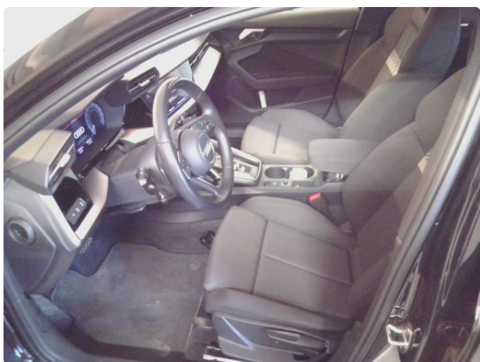
2.1 Ripe høyre bakfanger