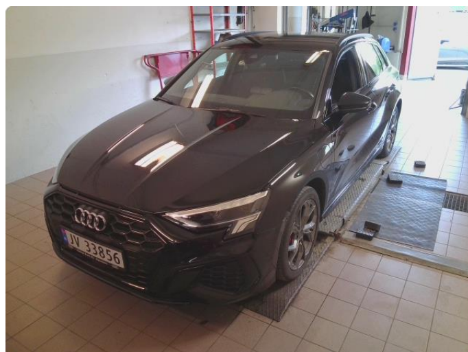
2.1 Ripe høyre bakfanger