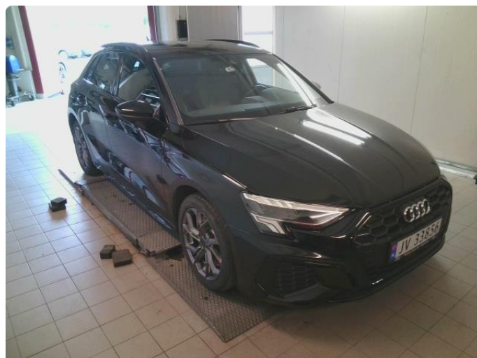
2.1 Ripe høyre bakfanger