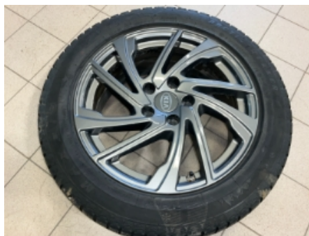
35. Ekstra hjulsett