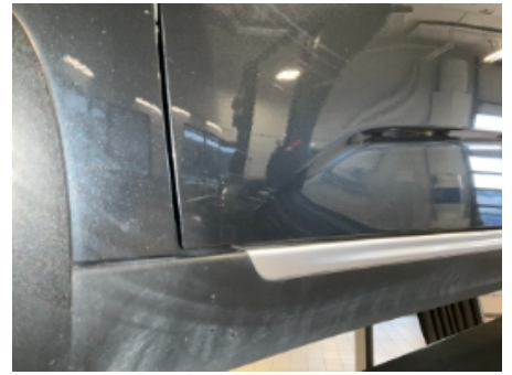
27. Lakk / karosseri utvendig