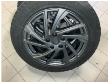
32. Ekstra hjulsett