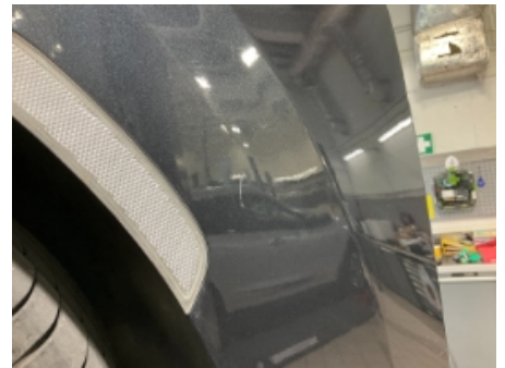
18. Lakk / karosseri utvendig