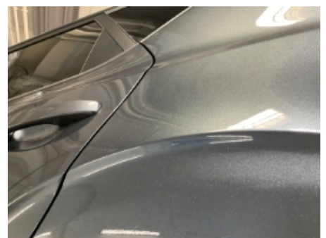
24. Lakk / karosseri utvendig