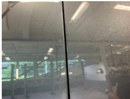
17. Lakk / karosseri utvendig