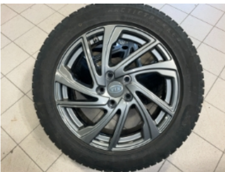
34. Ekstra hjulsett