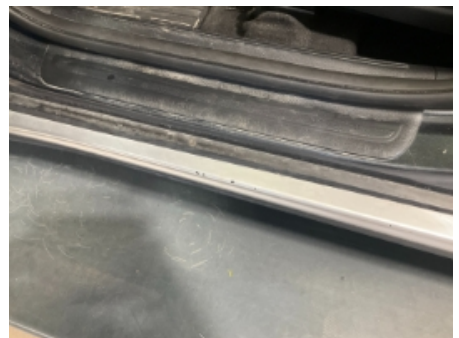
42. Lakk / karosseri utvendig