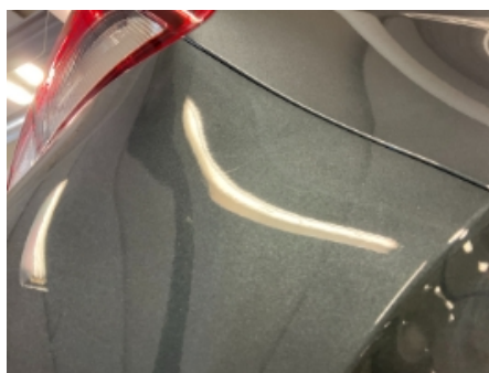
23. Lakk / karosseri utvendig