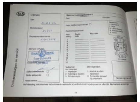
36. Service/ Dokum.