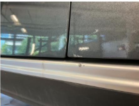
19. Lakk / karosseri utvendig