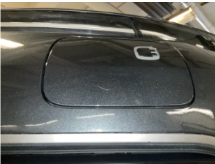
28. Lakk / karosseri utvendig