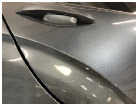
20. Lakk / karosseri utvendig