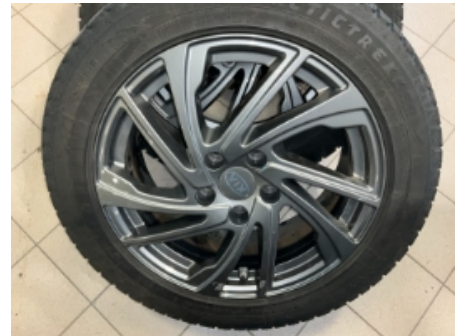
33. Ekstra hjulsett