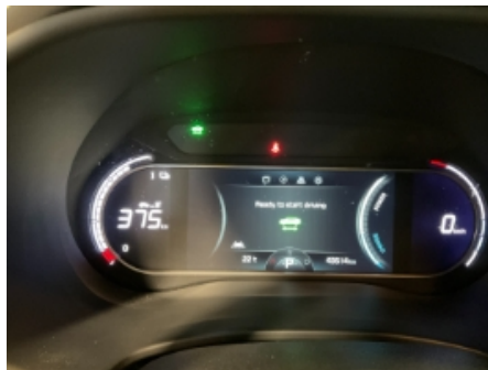
44. Service/ Dokum.