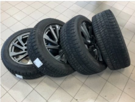
31. Ekstra hjulsett