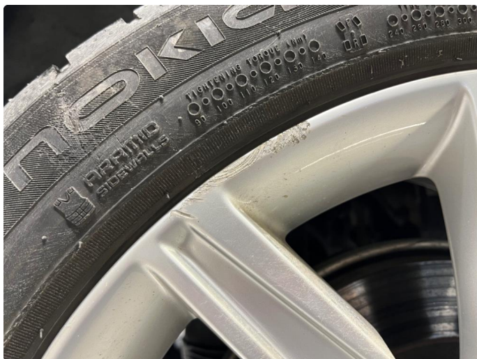
1.1 Kantkjørt felg.