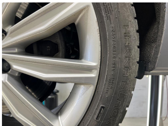
1.1 Kantkjørt felg.