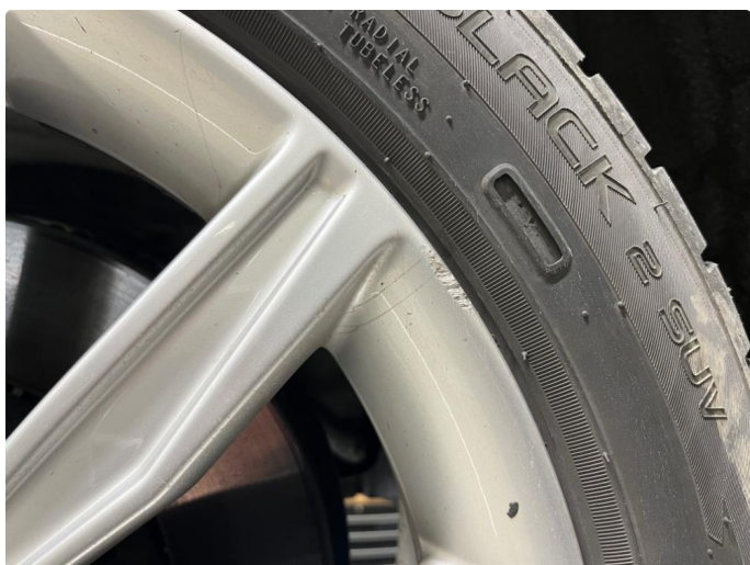
1.1 Kantkjørt felg.