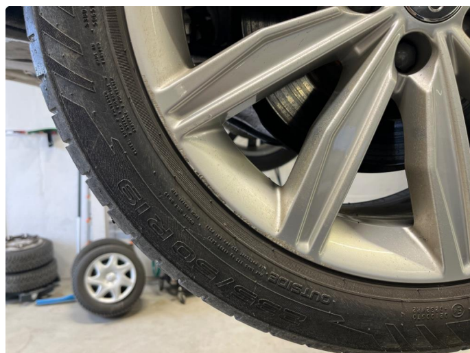
1.1 Kantkjørt felg.