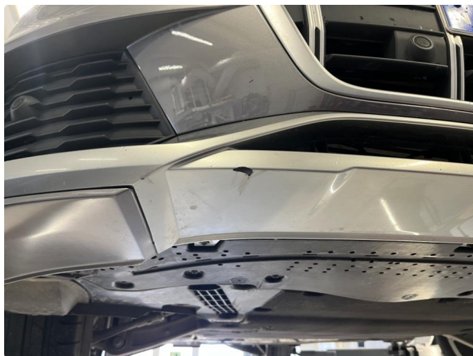
1.2 Skrubbskader underkant