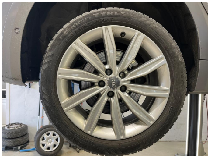
1.1 Kantkjørt felg.