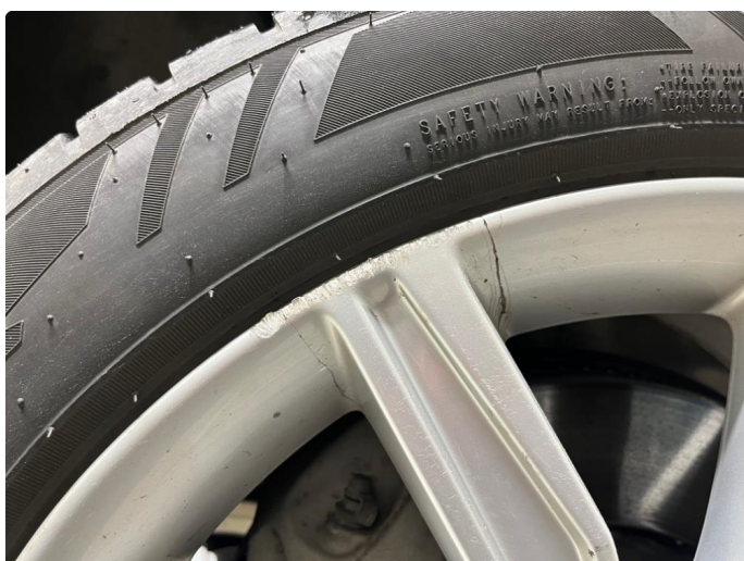
1.1 Kantkjørt felg.