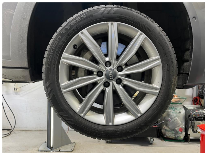
1.1 Kantkjørt felg.