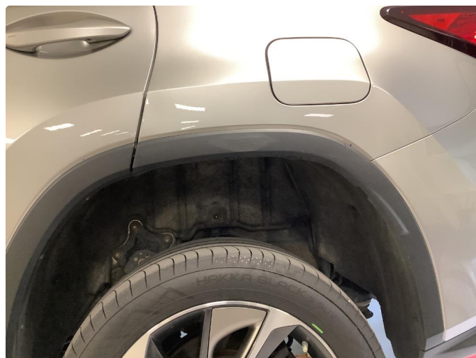
1.1 Ripe(r) i plast bredder