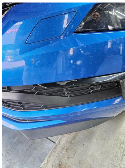
1.2 Noe flass på pianosort plast-deksel, frontfanger v.side