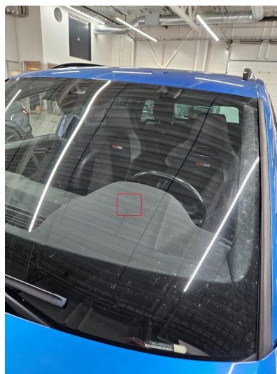
1.3 Steinsprut, for liten til rep./liming, notert for info