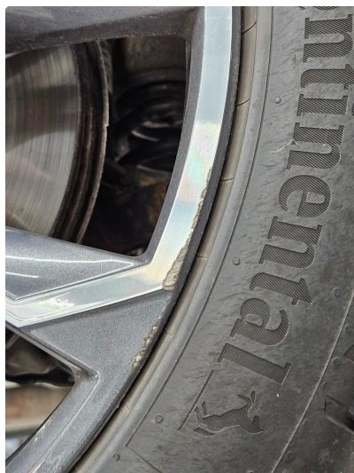
1.1 Liten skrubb på ytre kant, v.side bak