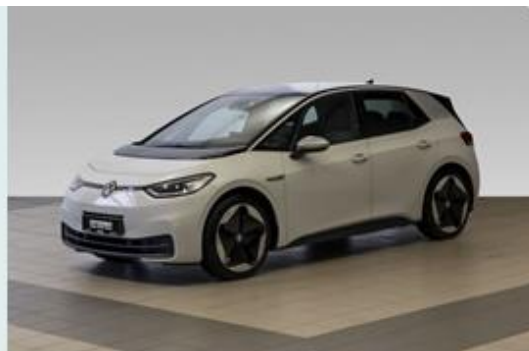
Frydenbø | Ålesund

Se mer om forutsetningene for vurderingen og andre vilkår på siste side.