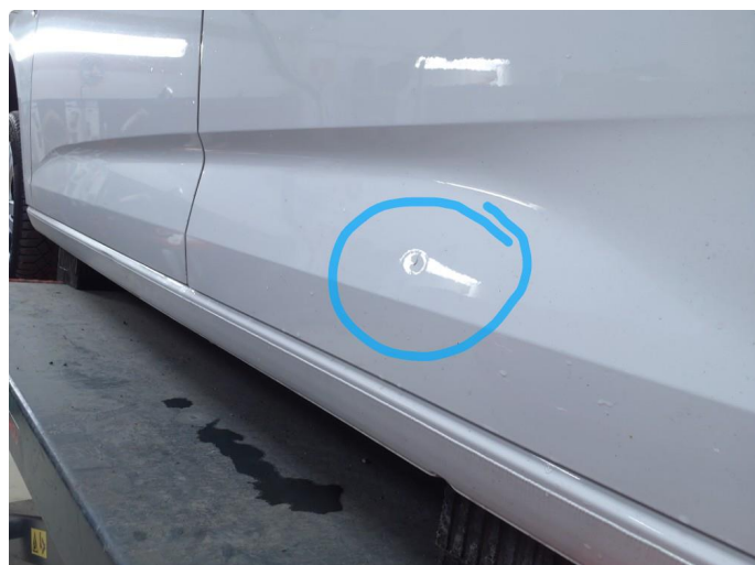
1.2 Bulk med lakkskade