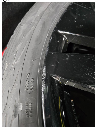
1.2 Skrubber på ytre kant av en vinterfelg, blitt flekket med lakk