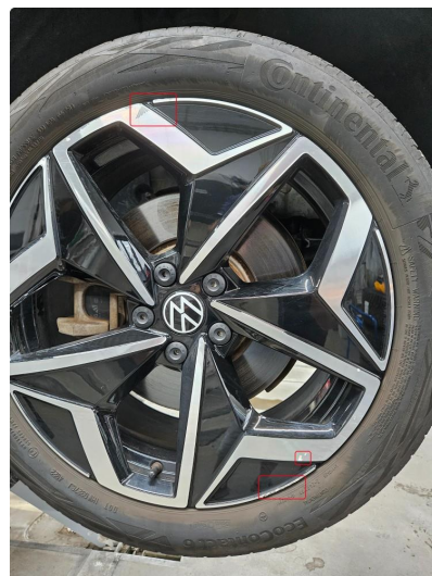
1.1 Små skrubbermerker/sår på 3 av 4 sommerfelger