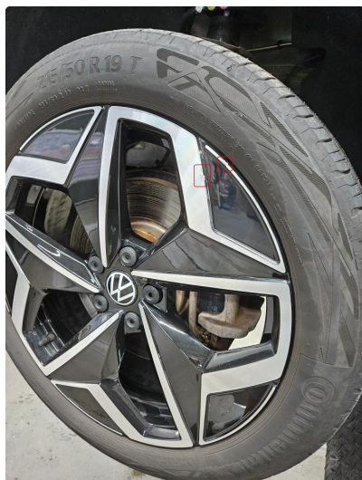
1.1 Små skrubbermerker/sår på 3 av 4 sommerfelger