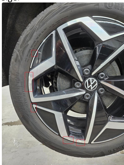
1.1 Små skrubbermerker/sår på 3 av 4 sommerfelger