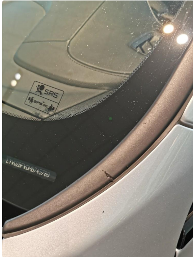
1.1 Liten skade i pakning ved frontvindu venstre side.