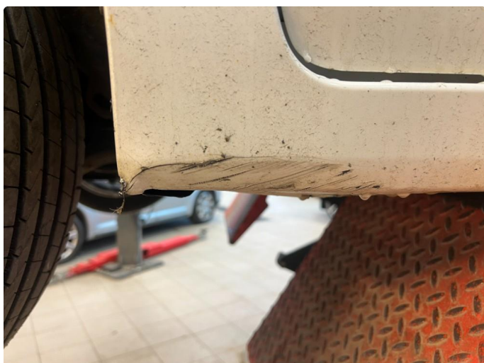
1.3 Liten skade