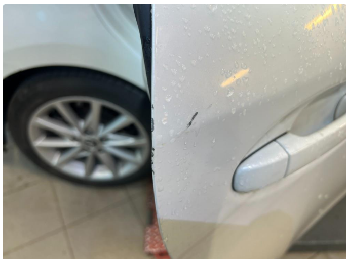
1.1 Liten skade