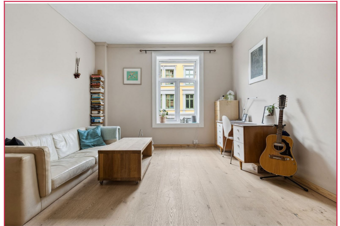
Romslig stue med peis