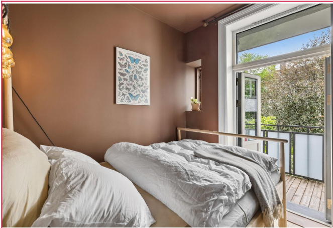
Innbydende soverom med garderobeskap og utgang til balkong