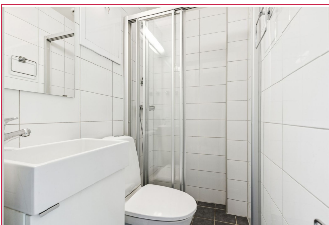
Flislagt bad med varmekabler.