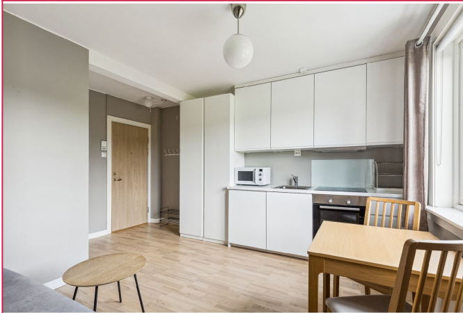
Attraktiv 1-roms leilighet på 17 kvm beliggende i byggets 2 etg.