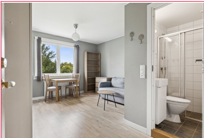
Boligen er delvis møblert med praktiske møbler som sovesofa.