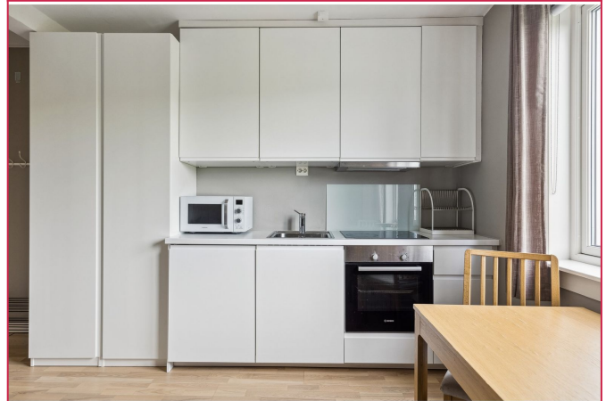
På kjøkkenet har du komfyr, platetopp, mikro, kjøleskap med mini fryser.