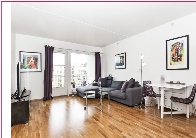
Romslig stue med utgang til stor solrik balkong som vender mot vest.