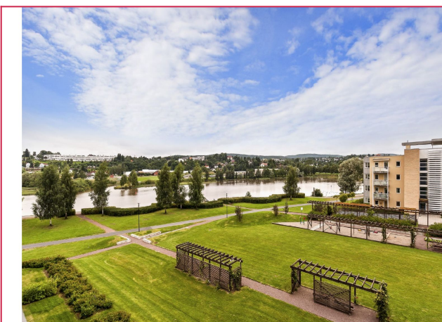
Leiligheten ligger ca 5 min gange fra togstasjon og ca 10 min gange til sentrum av Lillestrøm.