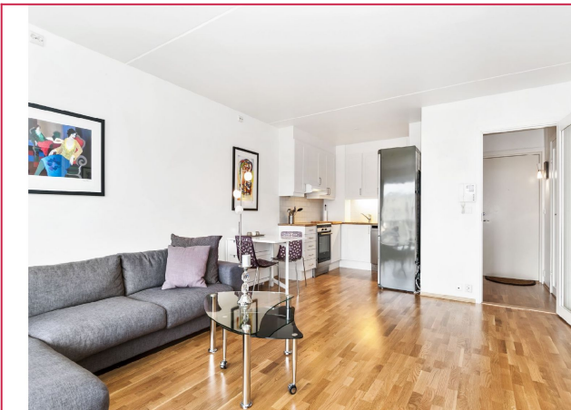
Stue og kjøkken i åpen løsning.