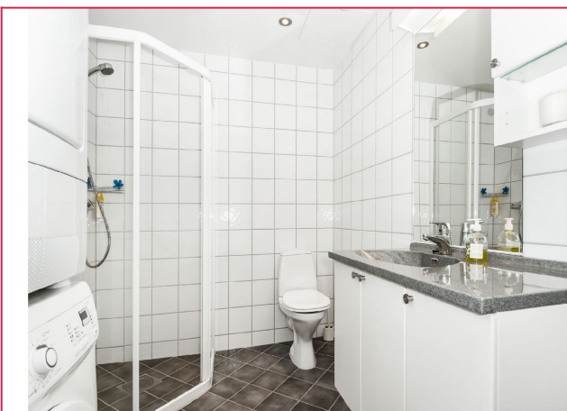
Romslig bad med mulighet for vaskemaskin og tørketrommel.