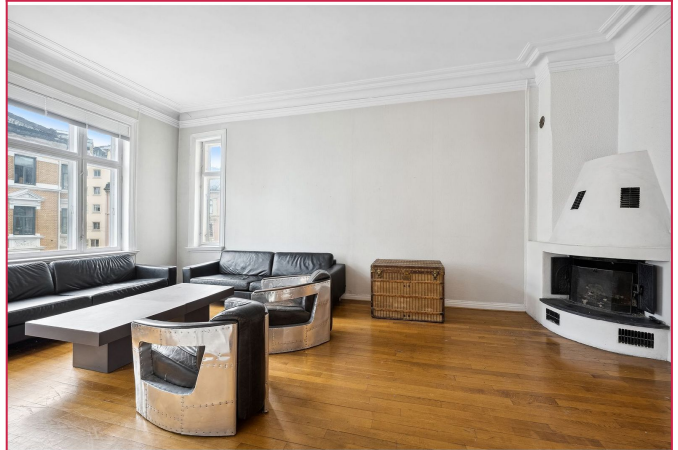
Stuen er stor og lys. Sofamøblement medfølger.