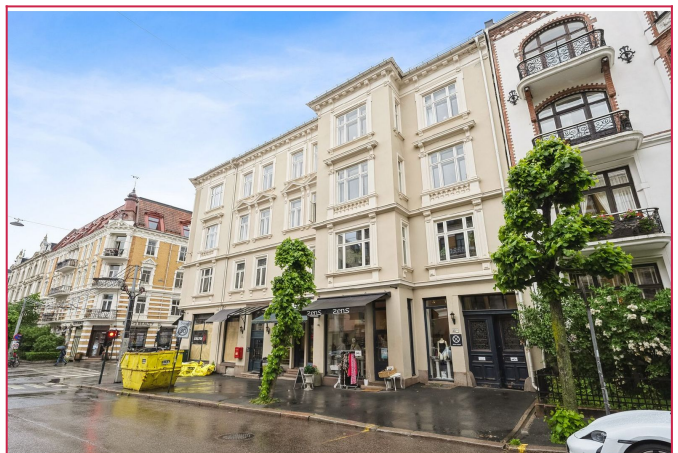
Velkommen til Niels Juels gate 40 B!