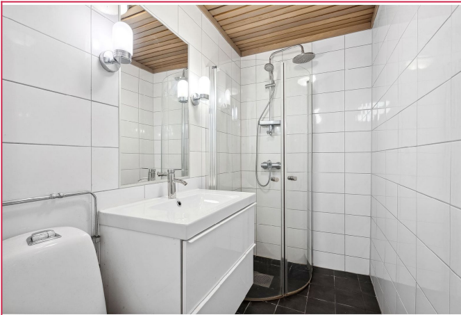
Tidløst og moderne flislagt badrom med gulvvarme