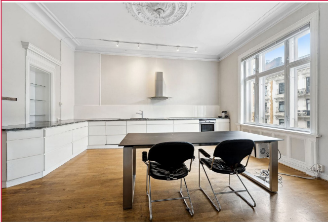
Svært romslig kjøkken med mye skap- og benkeplass, samt mulighet til spisemøblement.