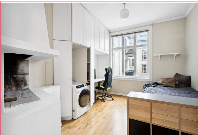
Soverom nummer to med gode oppbevaringsmuligheter, samt vaskemaskin som medfølger.