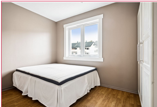
Romslig soverom med dobbeltseng.