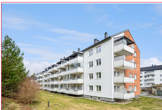
Velkommen til Steinspranget 15!