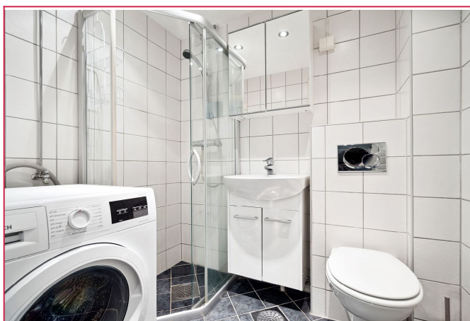
Flislagt bad med downlights i tak og vaskemaskin.