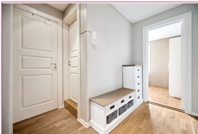
Entre med god plass til oppbevaring