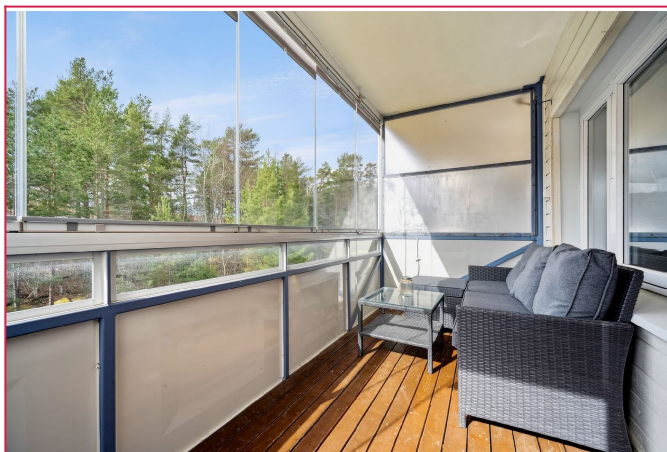
Innglasset balkong på ca 8 kvm