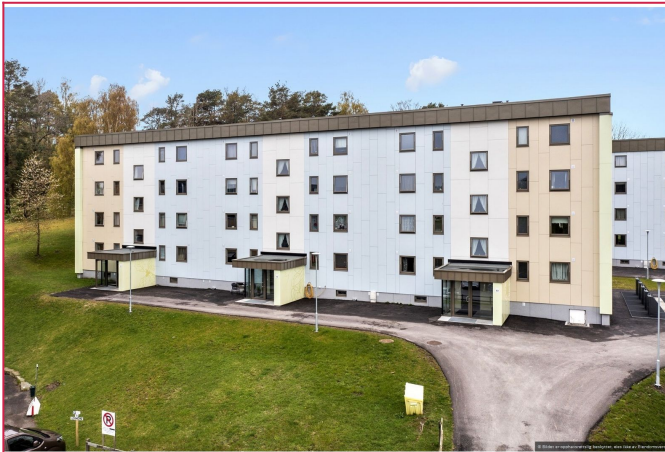
Velkommen til visning!