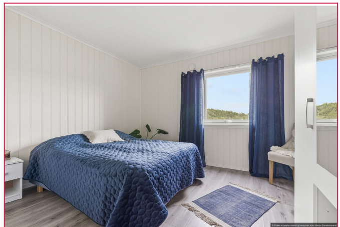
Lyst og luftig soverom.