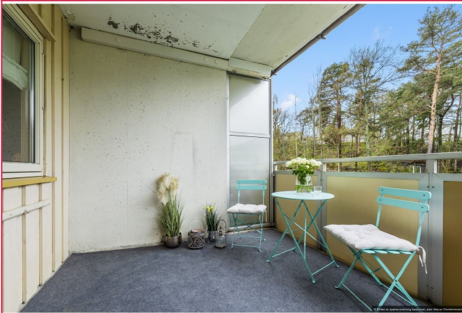
Overbygget, vestvendt balkong med gode solforhold.