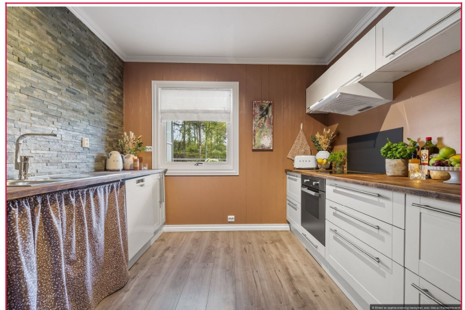
Kjøkken med god skap- og benkeplass.