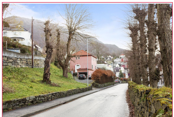
Sentral og rolig beliggenhet