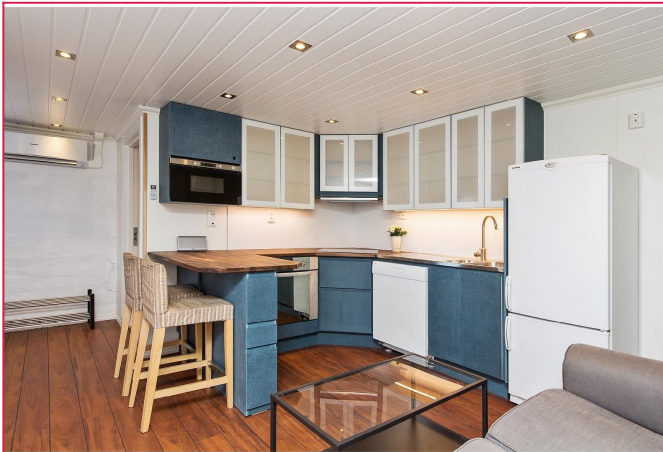
Pent kjøkken med smarte løsninger