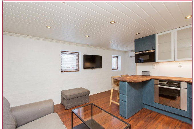
Kjøkken og stue