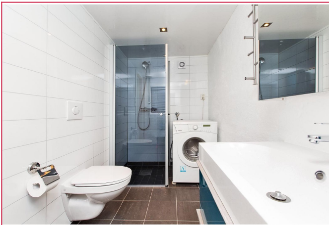
Flott og moderne bad