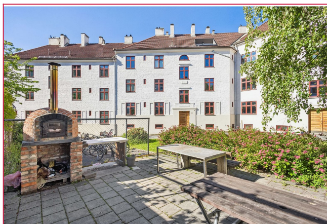
Pent opparbeidet fellesområde