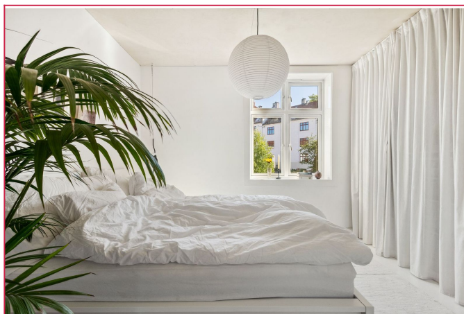
Soverommet er av god størrelse med plass til seng og tilhørende møblement